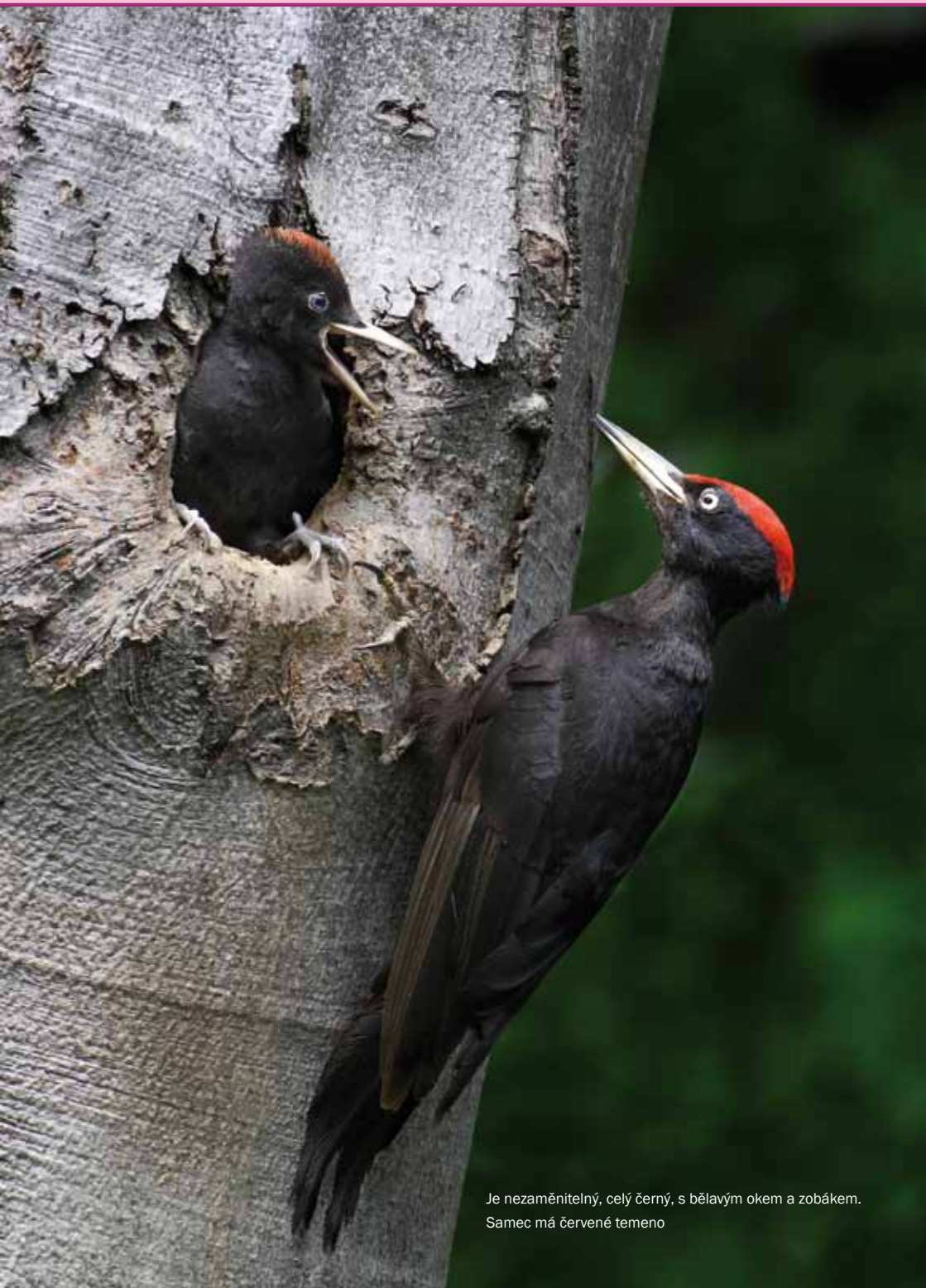
Je nezaměnitelný, celý černý, s bělavým okem a zobákem. Samec má červené temeno