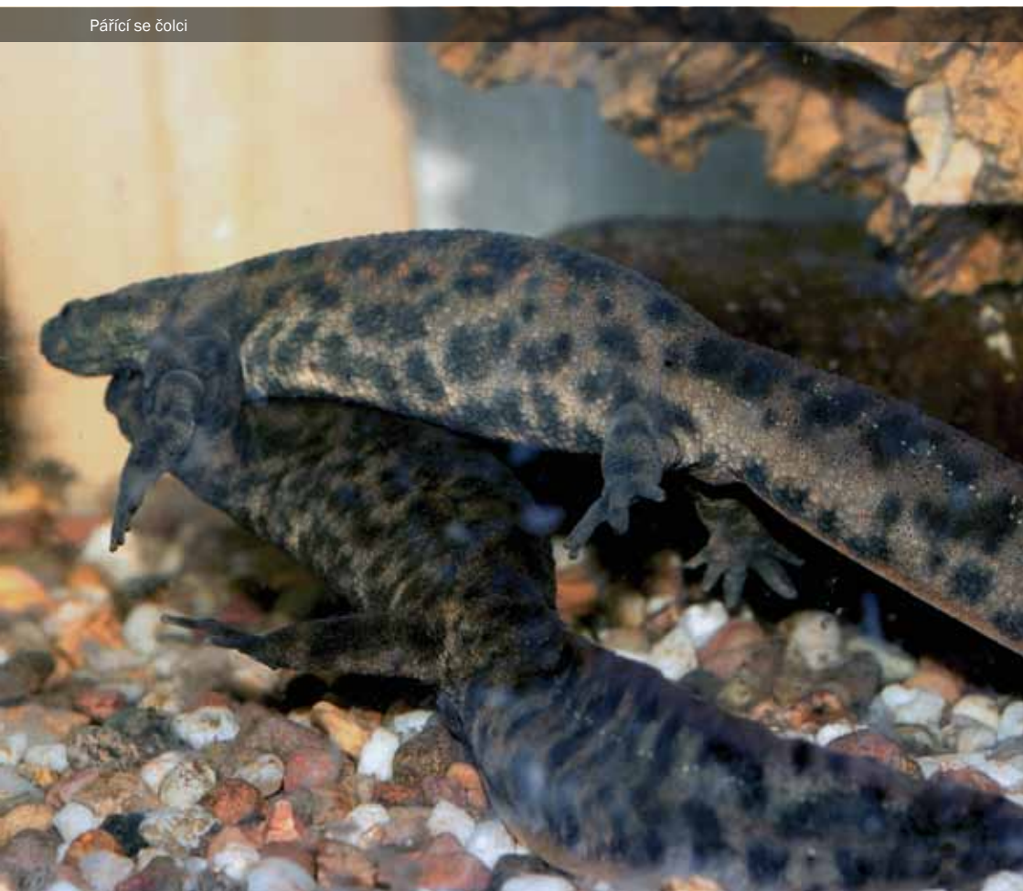
Pářící se čolci

Stačí několik teplých dnů (odborníci udávají, že při teplotě vody 20–22 °C jde o 8–9 dnů) a už se líhne 6–8 mm velká larva schopná samostatného pohybu. Její zbarvení je hnědé až černé se světlými skvrnami, a jakmile doroste 14 mm, začne se jí na přední končetině objevovat první prst.