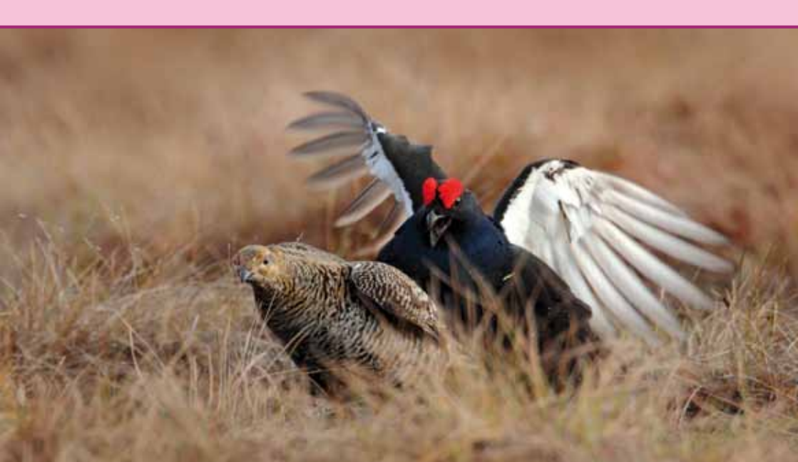
Slepička a kohoutek

Totéž platí i u péče o mláďata, takže se dá s jistou ornitologickou nadsázkou říci, že tetřivci jsou pěkně „krkavčí“ otcové bez ohledu na fakt, že právě krkavci žijí dlouhodobě ve stabilních párech, zatímco samec na tokaništi okamžitě po páření kouká, kde by koho ještě uhnal. Inkubace vajíček trvá 23–25 dnů, což se časově překrývá s dobou největší nabídky housenek. Prostě evoluce to zařídila, jak nejlépe uměla.