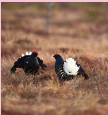
Tetřívci na tokaništi

Na tokaniště se samci slétají už časně zrána, mnohdy ještě za šera. Samotné „frajeření“ je energeticky dost náročné, ale na druhou stranu jde o zachování