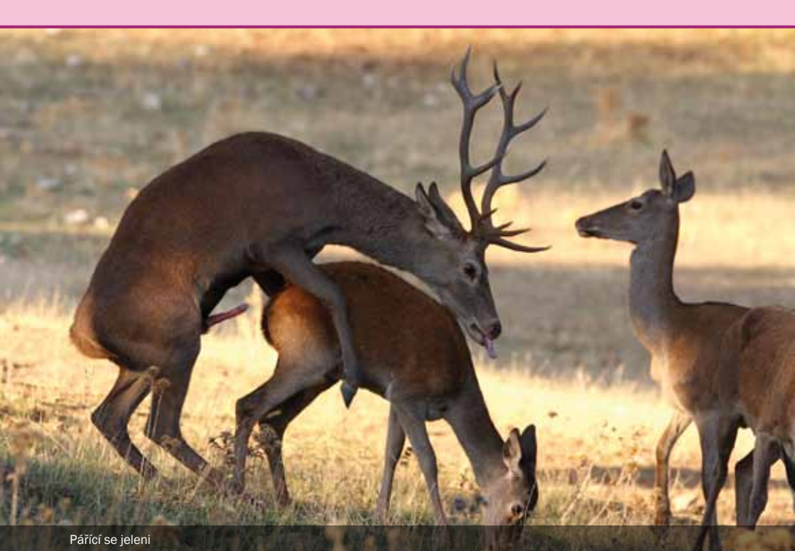
Pářící se jeleni

pomocí průtoku krve parohy, což končí právě s podzimem, kdy se přeruší proud krve a kůže uschne. Pro jelena je to chvíle, kdy začne suchou kůži odírat, aby odhalil nejen před samicemi, ale i před svými sexuálními konkurenty nové, čerstvé a nádherné parohy.