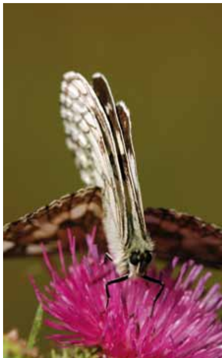
Páříci se okáči bojínkoví

Příroda v sobě skrývá hodně zázraků, ale proměna housenky v nádherného motýla, a nemusí jít jen o tropické krasavce, patří bezesporu mezi ty nejužasnější.