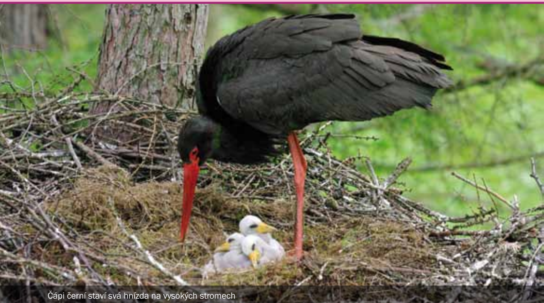
Čápi černí staví svá hnízda na vysokých stromech

další tři roky, než pohlavně dospějí a mohou se pokusit o pokračování rodu i rodiny.