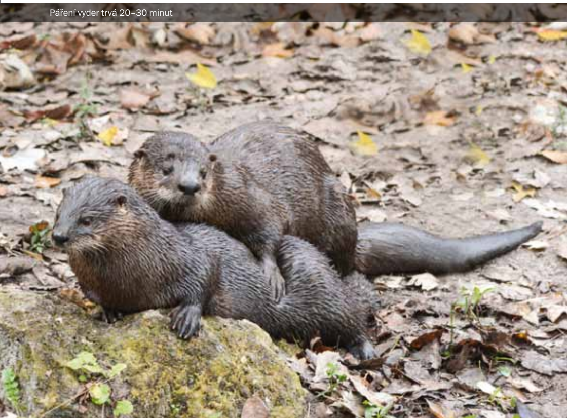
Páření vyder trvá 20–30 minut

Maso se, podobně jako maso bobří, prodávalo či dodávalo klášterům jako postní, protože podle církevní logiky tvor žije u vody, živí se rybami..., tak to vlastně ani není maso a může se jíst, podobně jako ryba, i v období půstu.