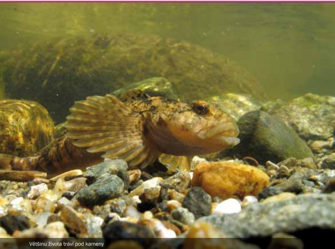
Většinu života tráví pod kameny

V Česku je řazena v Červeném seznamu do skupiny zranitelné. Obecně je indikátorem kvality, tedy čistoty vod, takže její přítomnost v krkonošských tocích je rozhodně dobrým znamením. Mimo jiné to znamená, že vranky nenajdeme ve stojatých či málo prokysličených vodách prostě proto, že by se v nich udusily. Jakkoli by se mohlo zdát, že sexuální život a jeho pokračování spojené se zrozením nového života je u ryb nudná záležitost, opak je pravdou. V případě vranek jde nejen o poměrně složité nalákání partnerky k místu páření, ale i o přípravu hnízda, a dokonce i starost o potomstvo, což není u ryb zase až tak častá záležitost. Ale sledujme láskyplnost vranek krok po kroku. Vranky se dožívají zhruba 10 let, ale pohlavně mohou dospět už v prvním roce života.