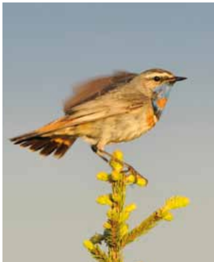
Slavík je o trochu menší než vrabec