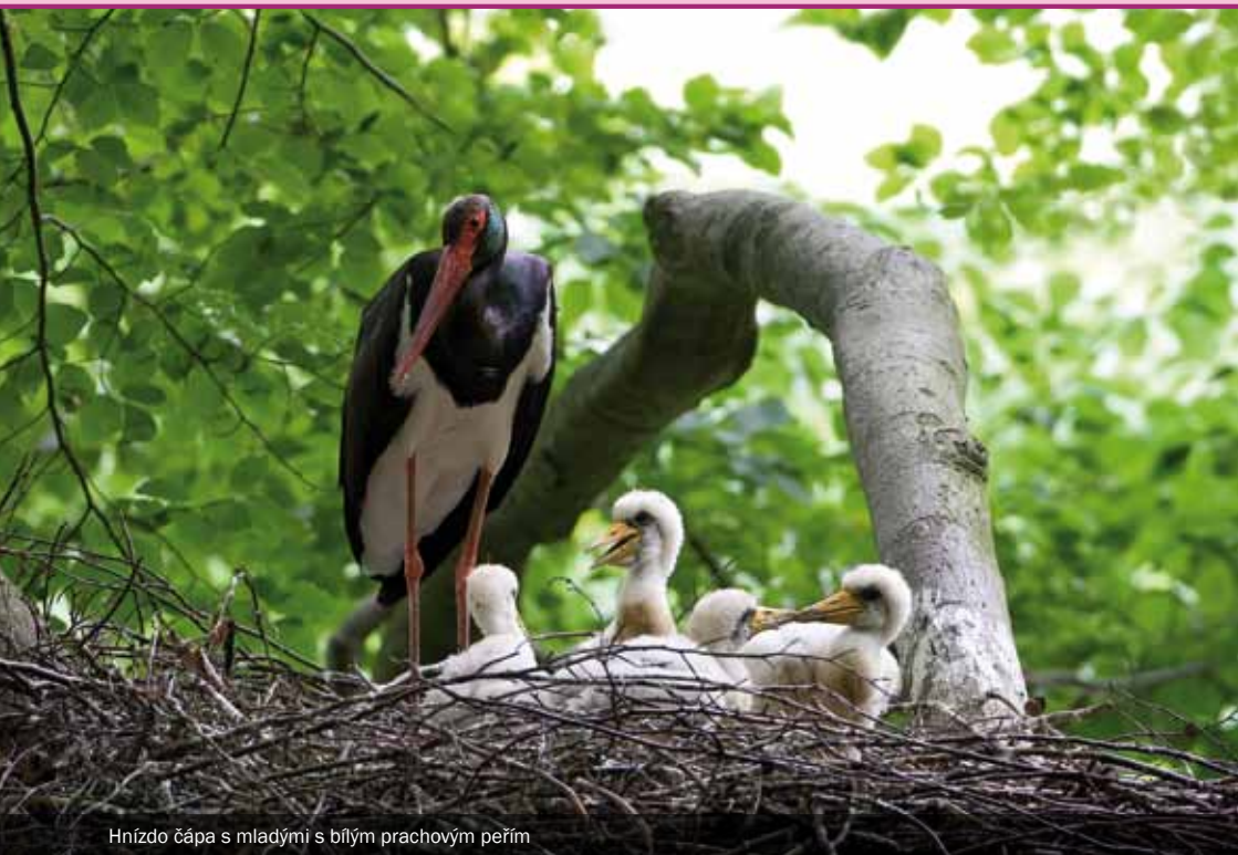
Hnízdo čápa s mladými s bílým prachovým perím