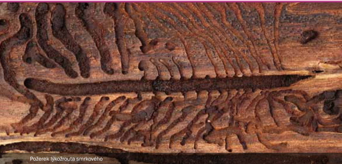
Požerek lýkožrouta smrkového

Aby dohnali, co loni nestihli, tak vylétají o 1–2 týdny dříve a dokrmují se v čerstvé kůře kmenů nebo odříznutých vrcholcích stromů. Základním úkolem je vyhloubit komůrku a vyházet drť. Vůbec nejde o práci bez rizika, protože strom se brání vypouštěním pryskyřice a mnoho lýkožroutích samců uvízne a zemře v lepkavém „jantaru“, což mění původně vyrovnaný poměr pohlaví. Proto se není co divit, že ti, kdo přežijí, mají šanci získat více než jednu partnerku. Už víte, proč některé požerky mají více než jednu zásnubní komůrku? Tyto komůrky navíc bývají vyhlodány v kůře, takže po sloupnutí kůry nejsou v lýku patrné.