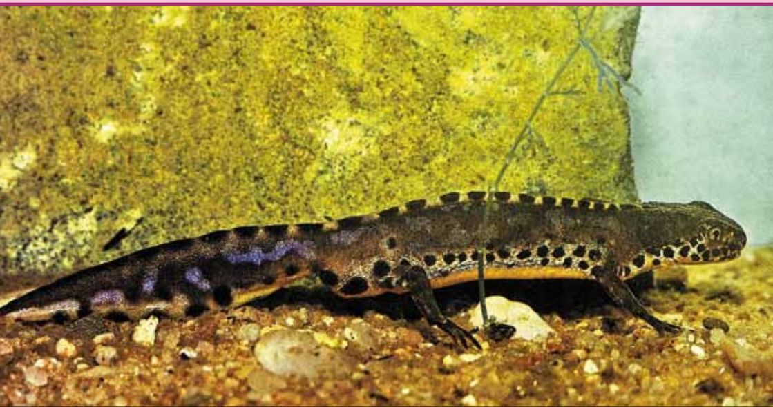
Bříchní stranu má čolek horský žlutooranžově až ohnivě červenou

Běžným pravidlem bývá, že samec je větší než samice, ovšem u tohoto druhu to neplatí. Samičky dosahují délky až 12 cm, do čehož samcům dobré 3–4 cm chybí. Čolci jako dospělci žijí na suché zemi, ale páří se výhradně ve vodě. Jakmile se alespoň trochu prohřejí tůňě, začínají se čolci pomalu pohybovat po dně a následně i začínají plavat s končetinami přitisknutými k tělu.