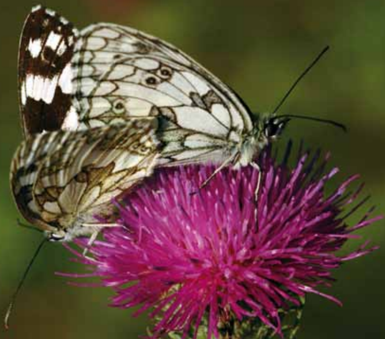
Okáči mají zřetelnou pohlavní dvojtvárnost

Ano, v našem výběru sexuálních praktik došla řada na motýly. Roku 1918 popsal J. Sterneck poddruh hnědého motýlka se žlutými pruhy. Huňatec žlutopásný krkonošský ( Psodos quadrifaria ssp. sudetica ), patřící mezi píd'alcky, je místním endemitem, což znamená, že se mimo krkonošskou přírodu nevykytuje. Určovací klíč, podle něhož by měl jít rozeznat, mimo jiné píše: „ Délka předního křídla 11–13 mm. Křídla tmavě hnědá s výraznou oranžovou skvrnou. V kopulačním ústrojí samce costa s malým výrůstkem, opatřena párovými štěty. “ Vida, jak je pro motýlkáře píd'alcí „pindík“ důležitý. Kopulace neprobíhá za letu, ale po přistání, kdy se samec se samičkou otočí zadečky k sobě a spojí se. Zvládají to jak ve vertikální poloze, například na