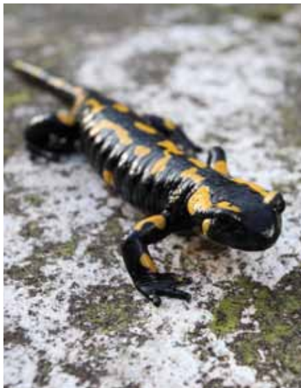
Mlok je charakteristický svým pomalým pohybem

Délka kolísá mezi 23–36 mm. Tak to alespoň vyplývá z měření 98 larev, jež se vylíhly na Olomoucku. Stadium volně plovoucích larev je zhruba tříměsíční, takže zhruba v srpnu se mladí mloci o délce kolem 6 cm vydávají poprvé na svou suchozemskou pouť.