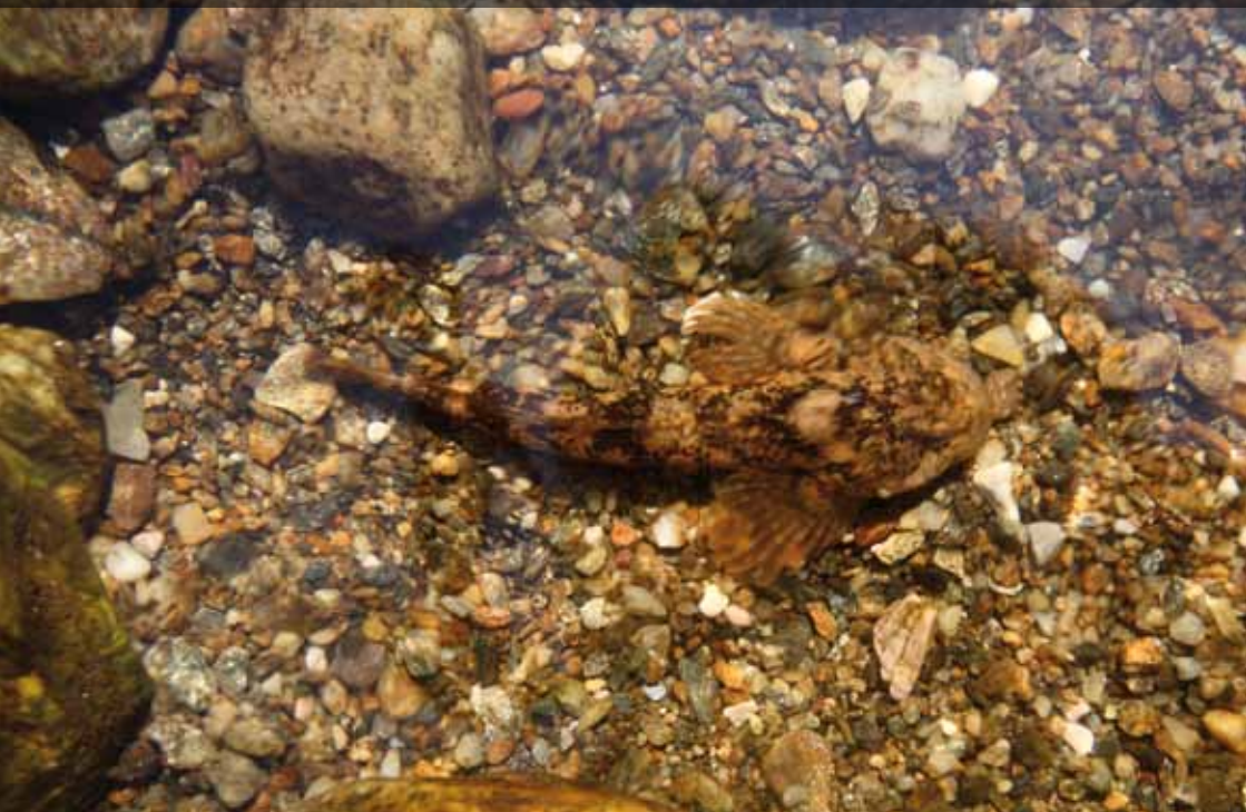
Vranka špatě plave, vpřed se pohybuje jen krátkými poskoky

Samičky se vytírají pod kameny na dně, proto vranku vědci označují za litofilní druh (lithos – kámen, filia – milovat). Samčí mlíčí je svou vnitřní stavbou podobně spíše spermii určeným pro vnitřní oplození, nicméně oplození je vnější. Pohyb vranky je kvůli absenci plynového měchýře poněkud legrační – vypadá, jako by poskakovala po dně, přičemž coby „odrážedla“ využívá vlastního ocasu.