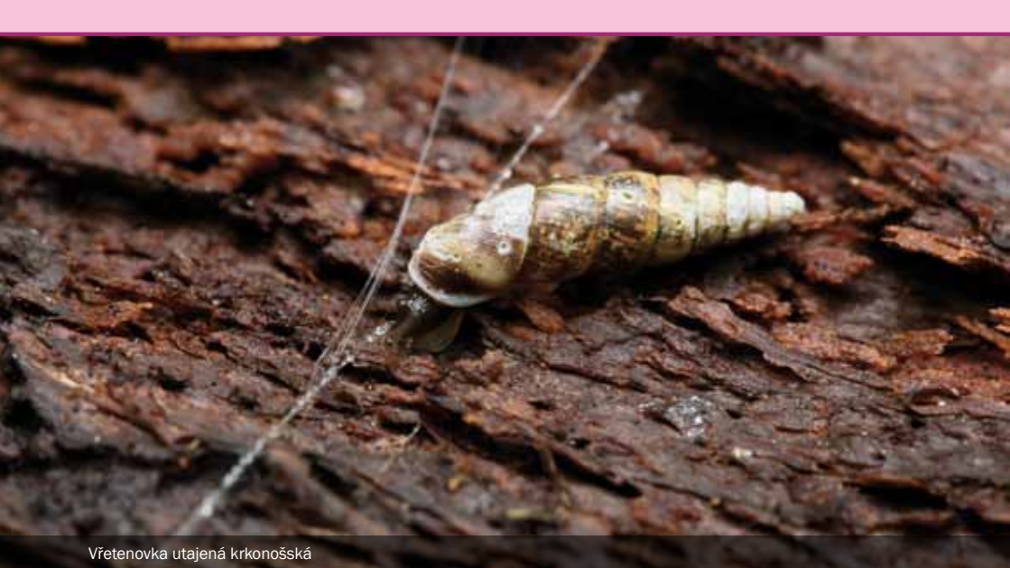
Vřetenovka utajená krkonošská