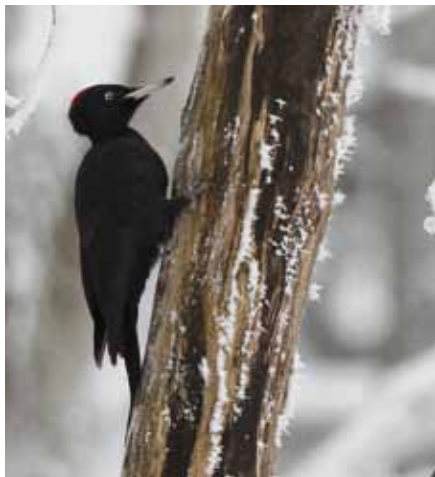
Hnízdo tesá obvykle jen samec

Někdy bývají ptáci s dutinou spokojeni a každoročně se do ní vracejí, jindy se rozhodnou pro trochu pracné stěhování, což obnáší vykloubání další dutiny, občas dokonce v bezprostřední blízkosti té původní. Většinou jsou dost vysoko na to, aby byly ze země špatně viditelné a zároveň pro některé predátory hůře dostupné. Jejich hloubka může přesáhnout půl metru, šířka vletového otvoru je v opravdových extrémech až 15 cm. Datel občas začíná tesat i několik dutin, čímž sice na jednu stranu poškozuje strom a plýtvá silami, ale testuje tak kvalitu dřeva. Někdy si ušetří práci tím, že rozšíří dutinu jiného ptáka. Nejedná se o zrovna energeticky levnou záležitost, vytesání nového bytečku mu trvá až 28 dnů a vyklove kolem 10 000 třísek. Zvláštní je, že páry, které se vracejí do již v minulosti využitých dutin, nehnízdí dříve než ty, které si budují „byteček“ znova. Člověk by řekl, že ušetřený čas věnují třeba sexuálním radovánkám. Nicméně evidentně je snůška načasována tak, aby se mláďata líhla v době největší potravní hojnosti, takže v tomto případě by úspěchání bylo