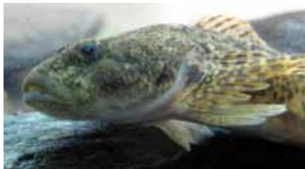
Vranka je bioindikátor čistoty vod

vpluje do samečkem vybraného hnízda, kde po rituálních tanečcích, jež jsou součástí „zásnubní“ ceremonie, naklade vajíčka. Mlíčák, tedy otec, má za úkol hlídat jikry po celou dobu inkubace, což znamená až do doby vykolení plůdku. To obnáší nejen jejich fyzickou ochranu včetně zastrašování případných návštěvníků, ale i provzdušňování vody máváním ploutvemi. Pokud je otec zkušený, tak najde hnízdo v místě, kde proud protéká skrz, což zajišťuje přísun čerstvé okysličené vody, ale zároveň tam není proud tak silný, aby hrozilo odnesení nalepených vajíček. V té době dobrovolně vyhlásí hladovku a po celou dobu nepřijímá potravu. Snad s občasnou výjimkou požití neposedné jikry, takže se vlastně stává občasným kanibalem. Jakkoli to může znít divně, důkazem byly rozbory žaludků vranek, které byly uloveny a usmrceny v rámci vědeckého výzkumu.