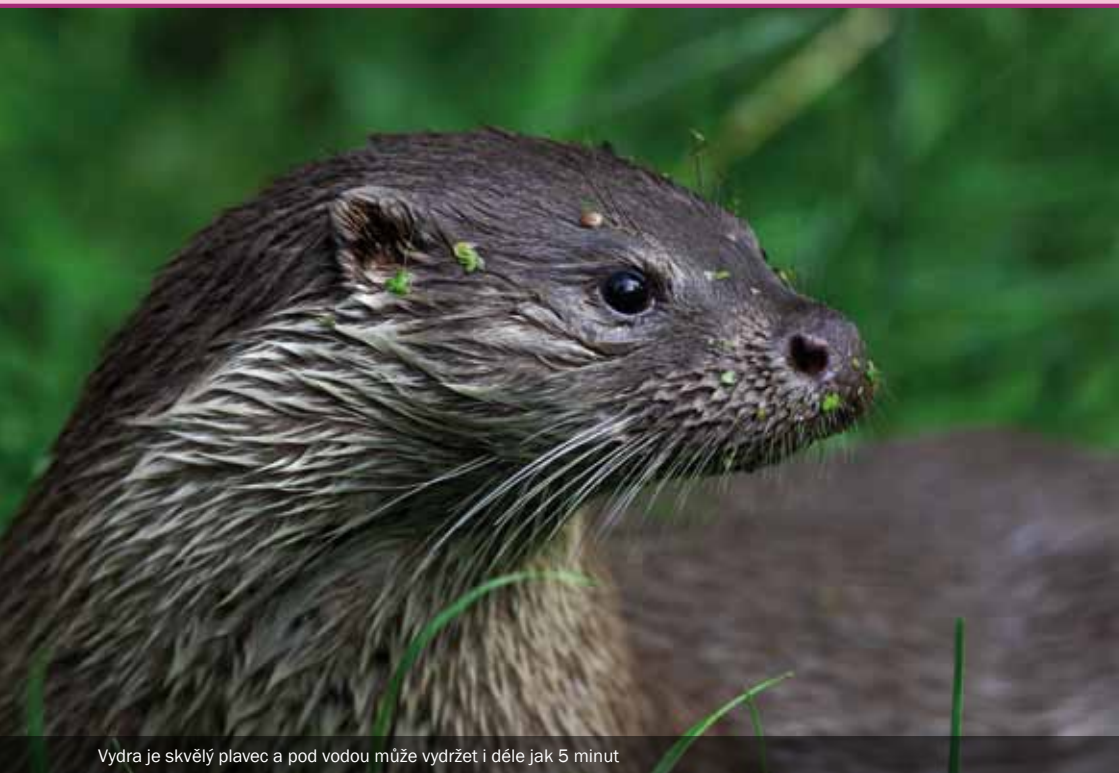
Vydra je skvělý plavec a pod vodou může vydržet i déle jak 5 minut

Vydry bývají svým značkovacím místům věrné, ale intenzita značkování se výrazně mění, zejména v závislosti na sezoně (většinou je nižší v létě, vyšší na podzim a v zimě, případně na jaře), ale i typu biotopu, dostupnosti potravy a konkrétních jedincích (jejich věku, pohlaví, sociálním postavení, fyziologickém stavu atd.).