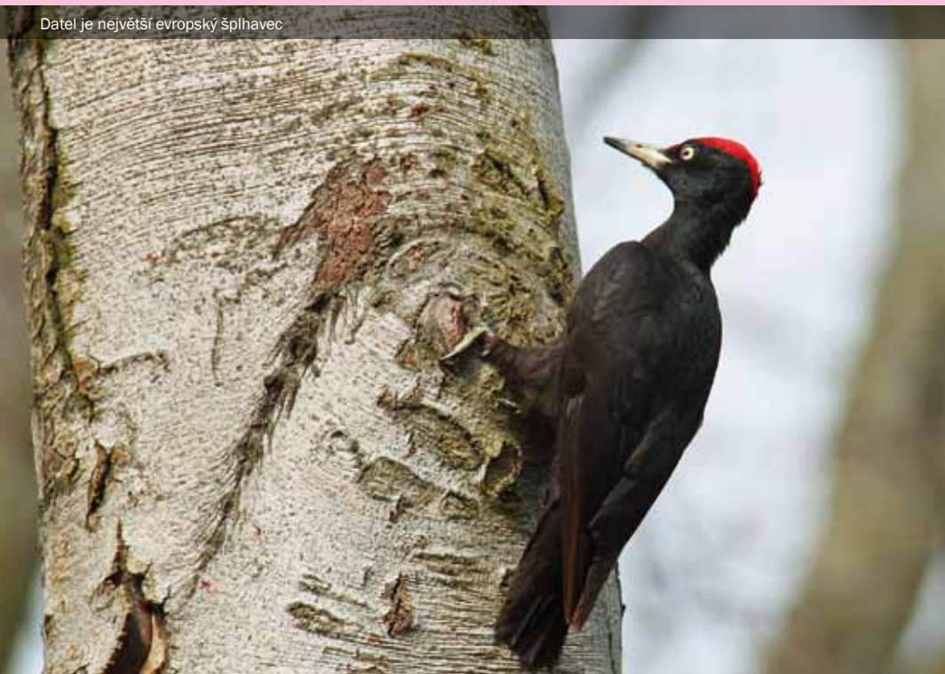
Datel je největší evropský šplhavec

jeden z páru se ozve zavoláním a druhý v odpověď bubnuje z hnízda. Samice často bubnuje na rezonující větev, čímž účinek svého vzkazu zesiluje. K páření dochází nedaleko hnízdní dutiny. Pár si vybere nějakou pohodlnou vodorovnou větev (přece nebude balancovat na nakloněné rovině), na kterou se budoucí matka rodiny přitiskne, a fakt, že je volná a svolná, dává najevo kýváním hlavou vodorovně ze strany na stranu. Dutinu ve většině případů vykutá samec.