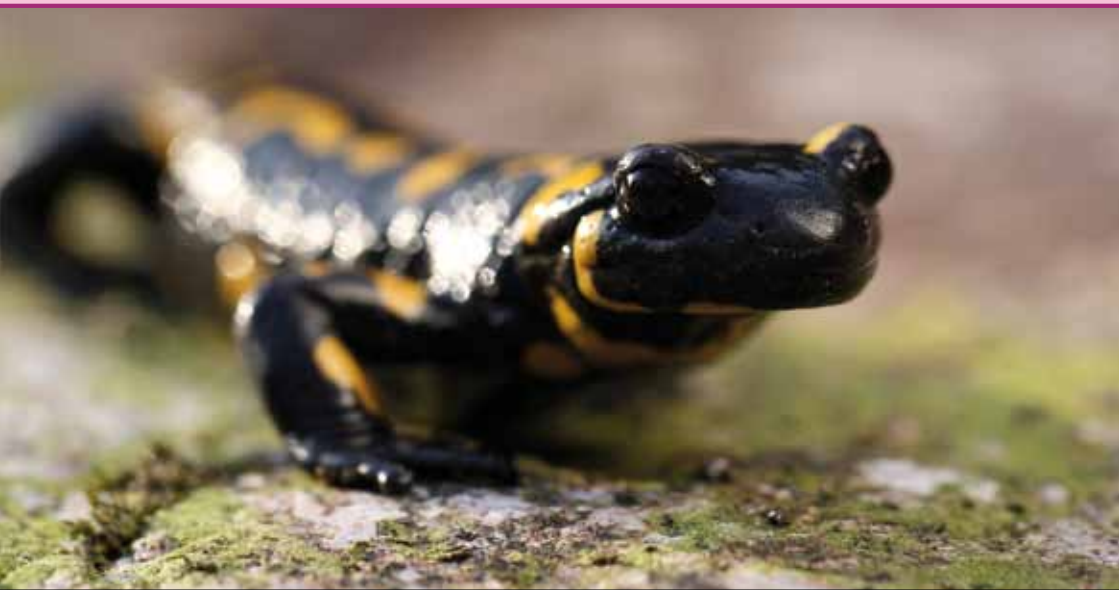
Tělo mloka zdobí žluté skvrny nebo pruhy