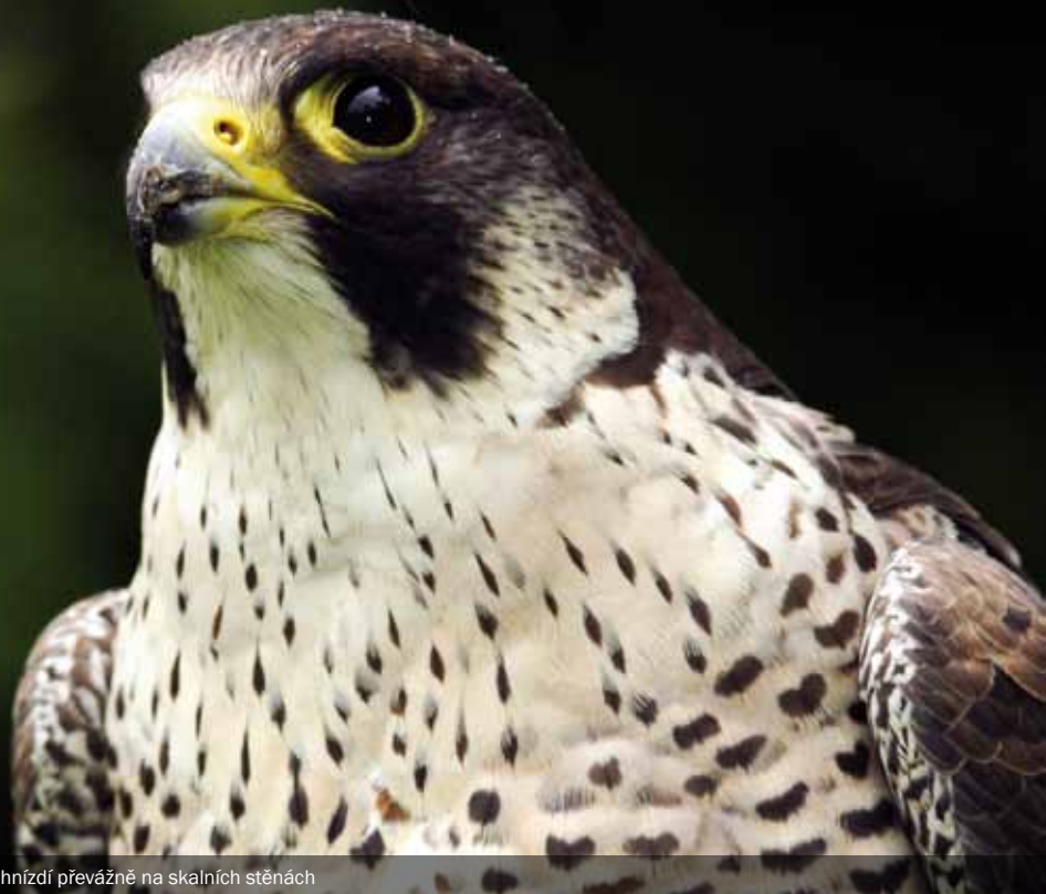
V přírodě hnízdí převážně na skalních stěnách

dubna nejčastěji 3–4 vejce. Jsou hustě červenohnědě až rezavě mramorovaná. Při inkubaci, tedy zahřívání vajec, se vzorně střídají oba rodiče, byť samice má na sezení přece jen větší podíl. Odborná literatura udává, že samice sedí na vejcích zhruba 75 % času. Mláďata se líhnou za 28–32 dnů. V té době nastupuje otec v roli lovce přinášejícího na hnízdo kořist, zatímco matka ji trhá a mláďata krmí. Ideální rodinně párová spolupráce. Mláďata rostou poměrně rychle a po 32–45 dnech opouštějí hnízdo, nicméně se ještě nějaký čas zdržují poblíž, protože jsou stále dokrmována. Pohlavní dospělosti dosahují za 1–2 roky, a jelikož se jedná o tažný až potulný druh se zimovištěm